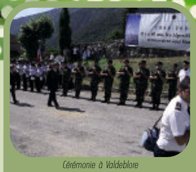
Cérémonie à Valdeblore