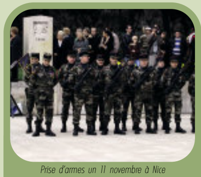
Prise d'armes un 11 novembre à Nice