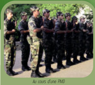
Au cours d'une PMD