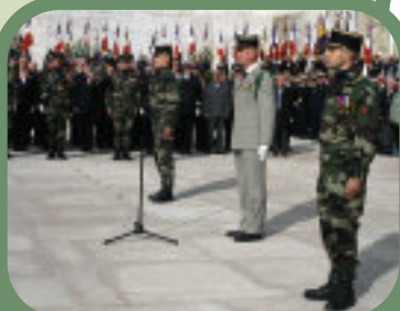
Passation de commandement au monument aux morts de Nice

L'ère du lait fraise est révolue, place au Gigondas !