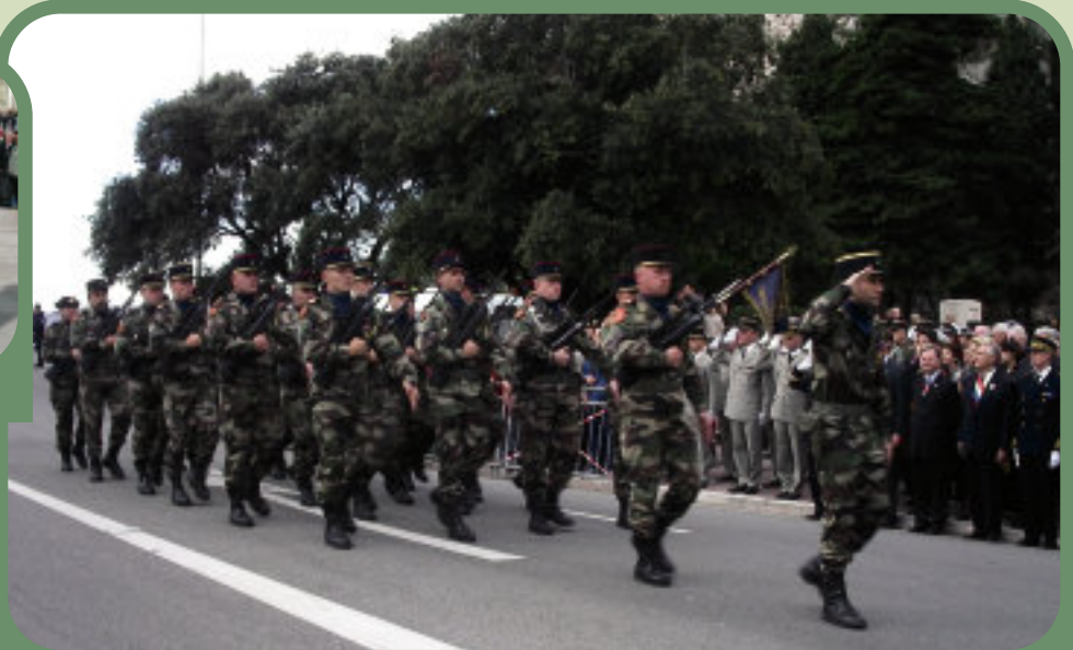
La 5ème Batterie défile, à Nice, le 11 novembre 2004, devant les autorités civiles et militaires