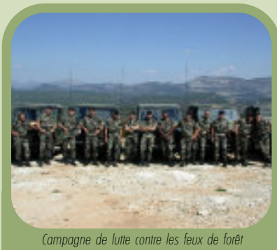
Campagne de lutte contre les feux de forêt