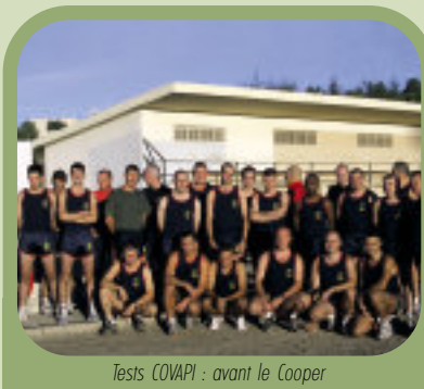
Tests COWAPI : avant le Cooper