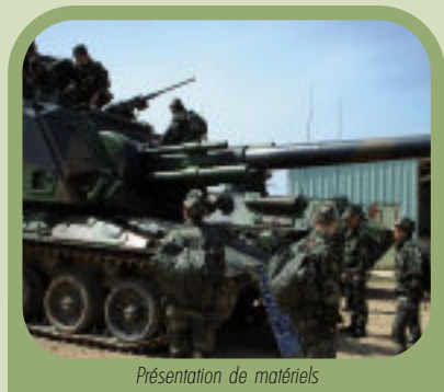
Présentation de matériels