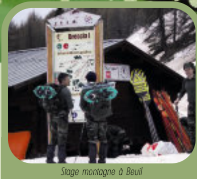
Stage montagne à Beuil