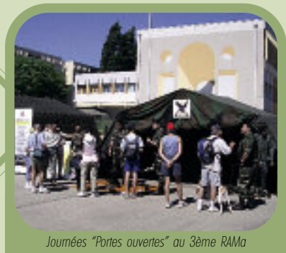
Journées "Portes ouvertes" au 3ème RAMa