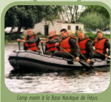
Camp marin à la Base Navale de Fréjus